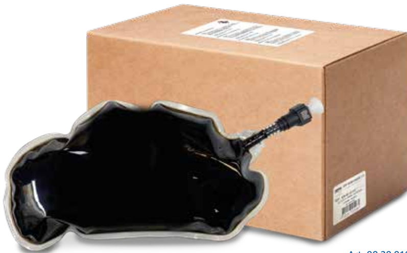
Art. 90 20 010.

Om het periodiek regenereren van de in het roetfilter opgehoopte roetdeeltjes te verbeteren zijn bepaalde auto's uitgerust met een doseersysteem voor een roetfilter additief. Dit doseersysteem heeft een tank of reservoirzak dat gedurende de levensduur een aantal maal moet worden bijgevuld. Voor de PSA-modellen vanaf bouwjaar 2000 welke zijn uitgerust met een reservoirzak, wordt geadviseerd de reservoirzak elke 100.000 km preventief te vervangen. Romax levert een volledig assortiment diesel DPF reservoirzakken voor de PSA-modellen. Zie het overzicht op de volgende pagina.